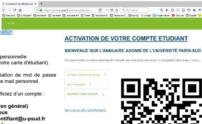
QRcode vers activation PSud

identifiant : prenom.nom (en général) Mot de passe : créé par vous adresse électronique : identifiant@u-psud.fr